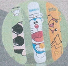
มีกลิ่นหอม