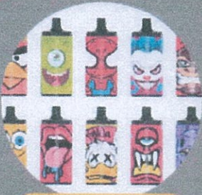
ลักษณะสวยงาม

บุหรีไฟฟ้ารุ่นใหม่มาในรูปแบบสวยงาม เพื่อดึงดูดความสนใจของเด็ก ผู้ปกครองต้องใส่ใจ สังเกต เพราะอันตรายร้ายแรงเท่าแบบเดิม