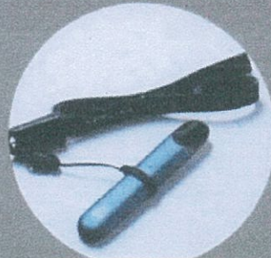
มีสายคล้องคอ