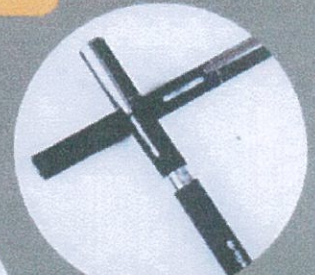
รูปทรงปากกา