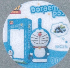
มีช่องให้สูบได้