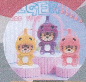
การ์ตูนหรือของเล่น